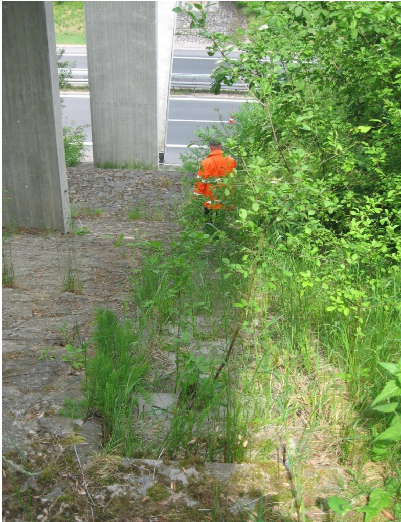
Bild 4: Wartungstreppe an Brückenbauwerk – auch für Materialtransport (Werkzeugkästen, ...)