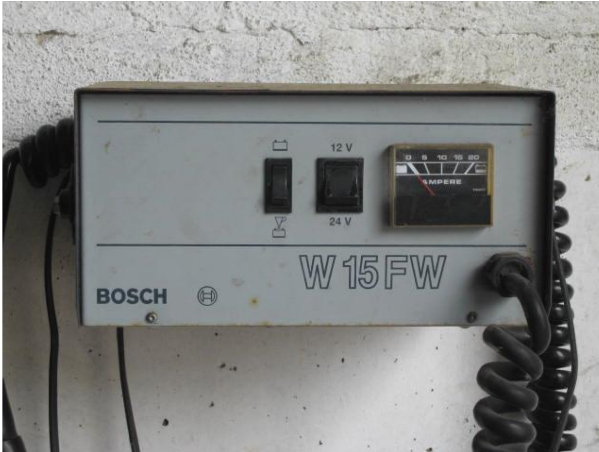
Ladegerät mit Umschaltmöglichkeit 12V – 24V