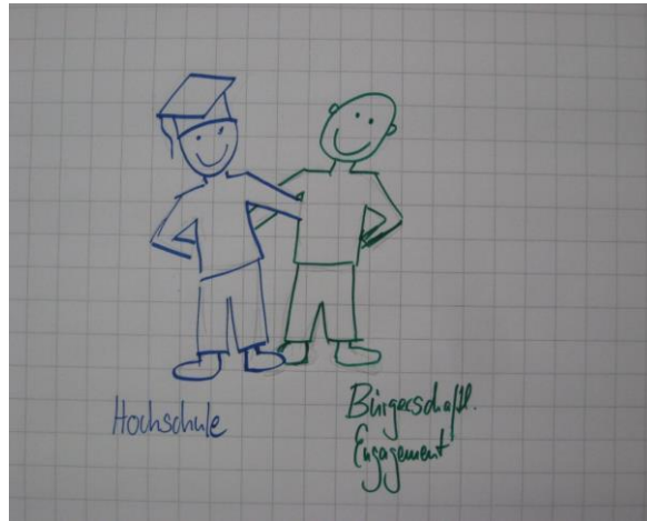
Kooperativ, partizipativ – gemeinsam Arbeiten

werden oder statistische Daten beispielhaft für eine Organisation ausgewertet werden. Darüber hinaus bieten Bachelor-/Masterarbeiten an, sich wissenschaftlich und aus einer Fachperspektive heraus, einer gesellschaftlichen Herausforderung anzunehmen.