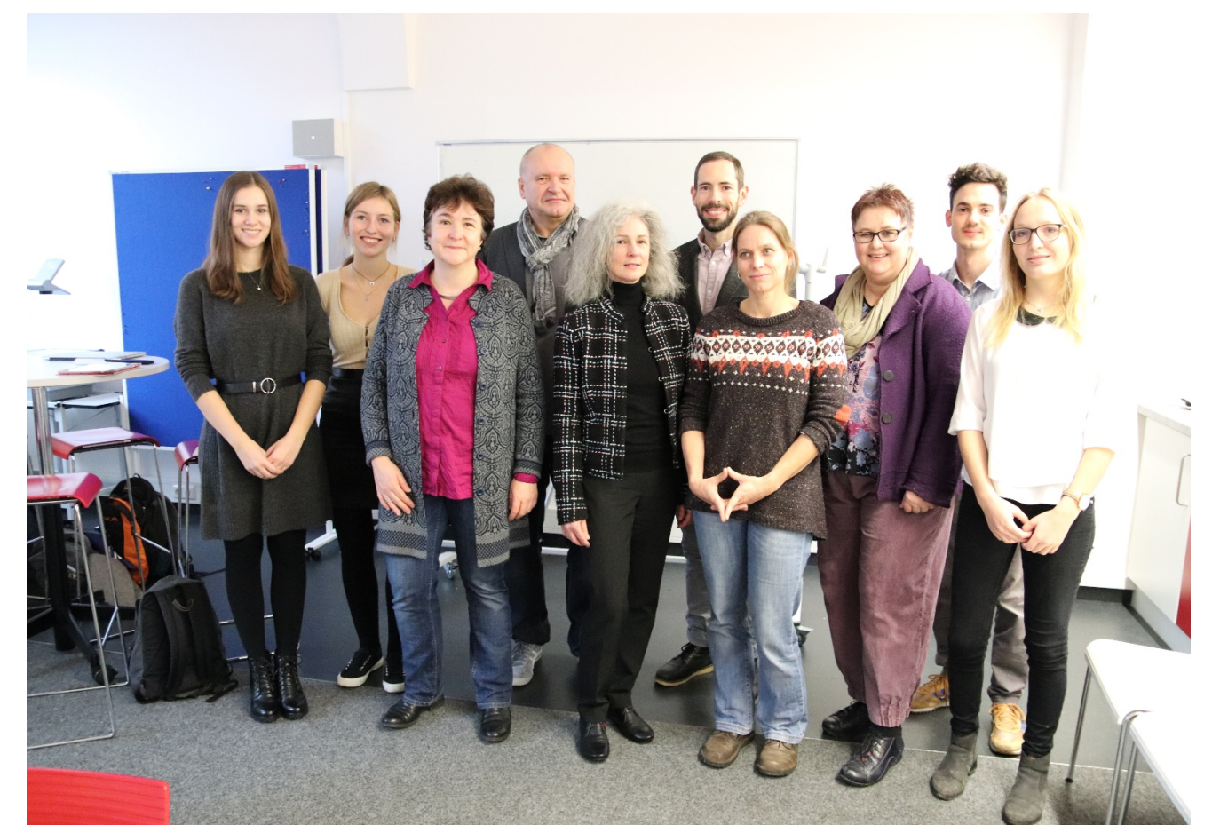
Auch für den Partner war der Workshop ein voller Erfolg

Der Workshop war sowohl für die Studierenden als auch die Führungskräfte des Sozialdienstes der Katholischen Frauen Augsburg e.V. sehr gewinnbringend. Studierende und Führungskräfte der Partnerorganisation erarbeiten gemeinsam einen Katalog mit passgenauen Maßnahmen, die der Partner nun kurz-, mittel- und langfristig umsetzen kann.