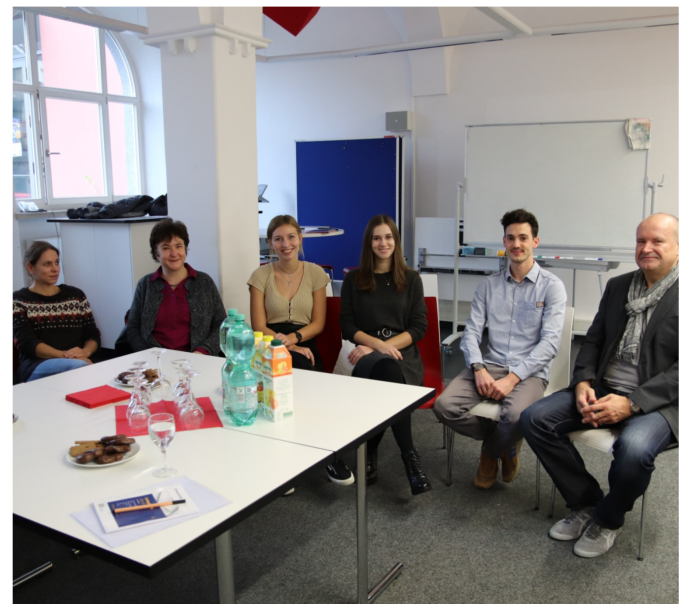
Ein Katalog an Maßnahmen wurde gemeinsam erarbeitet