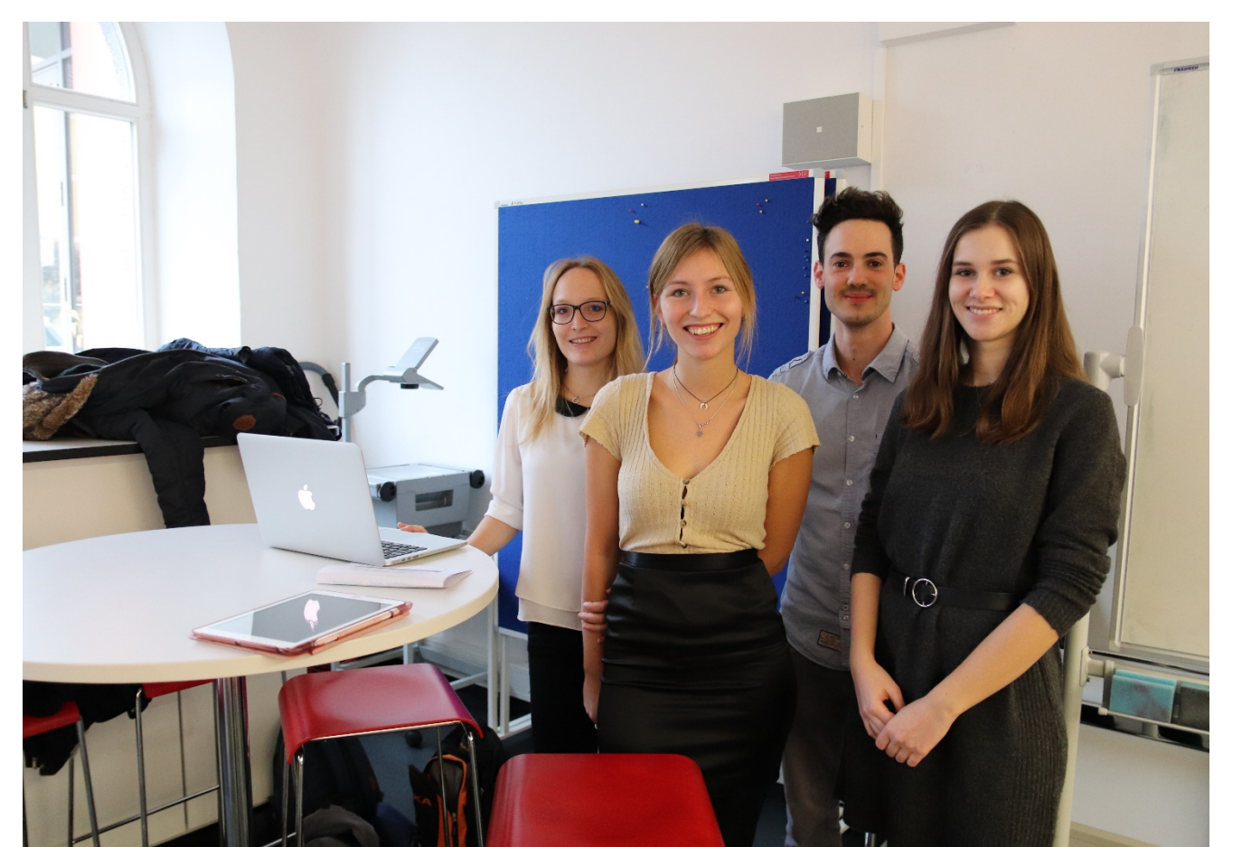
Die studentischen Experten für betriebliches Gesundheitsmanagement