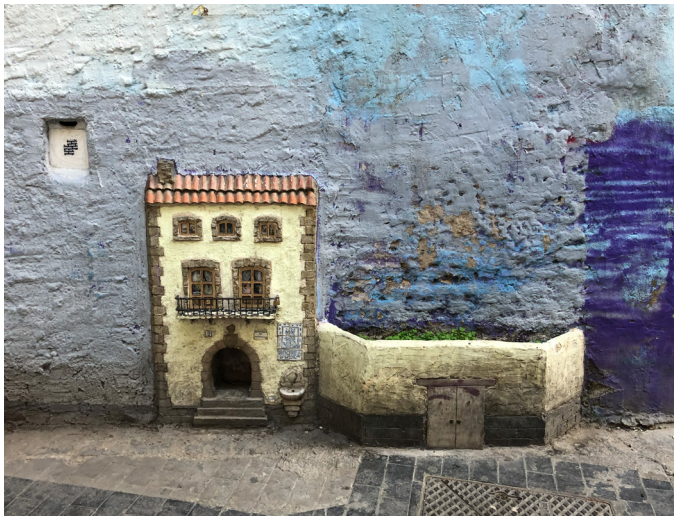
La casa de los gatos (Katzenhaus) in EL Carmen