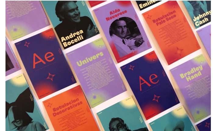
Tyo-Quiz; Endabgabe im Fach Typografie

In Valencia gibt es mehrere Agenturen, wie beispielsweise Erasmus Life, die Events und Ausflüge für Erasmusstudent:innen anbieten. Aufgrund von Corona habe ich persönlich selbst jedoch nur Ausflüge mit den anderen Erasmusstudent:innen gemacht.