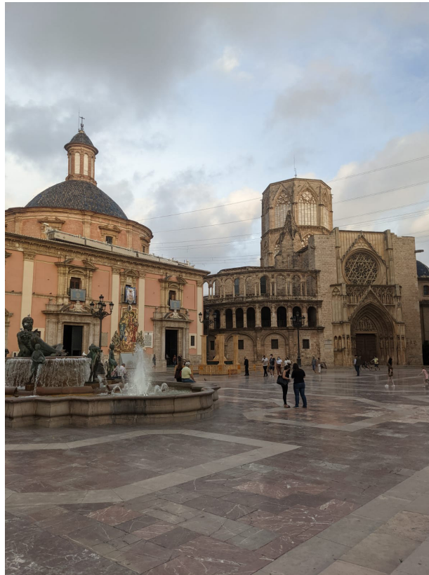
Plaza de la Virgen (3 min von der Uni entfernt)