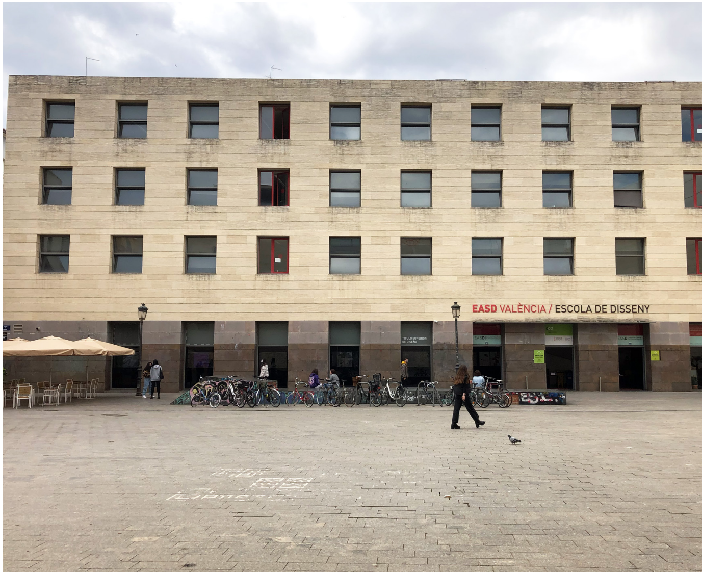
Hauptgebäude der EASD am Plaza de Viriat