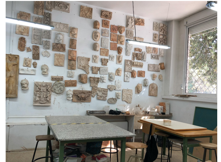
Töpferwerkstatt am Campus Vivers