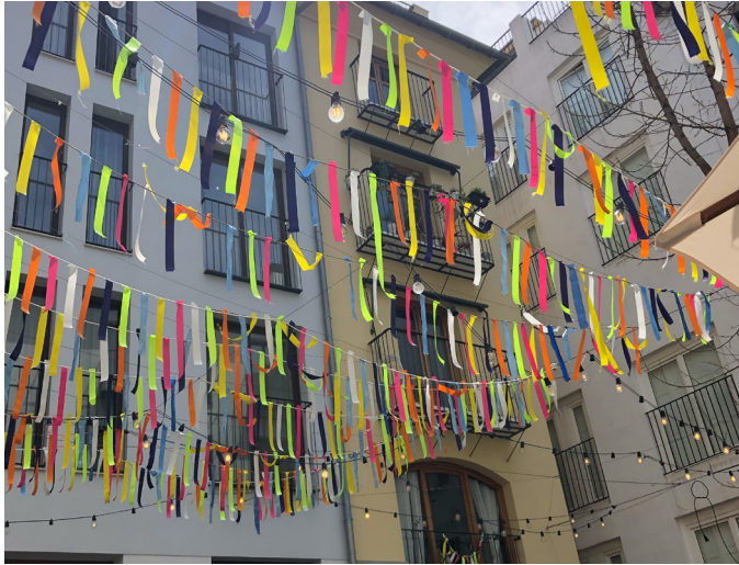
Einer der unzähligen süßen Plätze mit Restaurants & Cafés