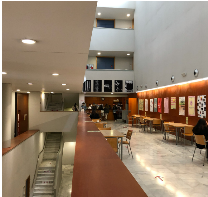
Cafeteria der EASD

Die Lebenserhaltungskosten in Valencia sind vergleichbar mit denen von Augsburg. In der Altstadt sind die Preise natürlich etwas höher als außerhalb. Preiswerter Wohnen kann man zum