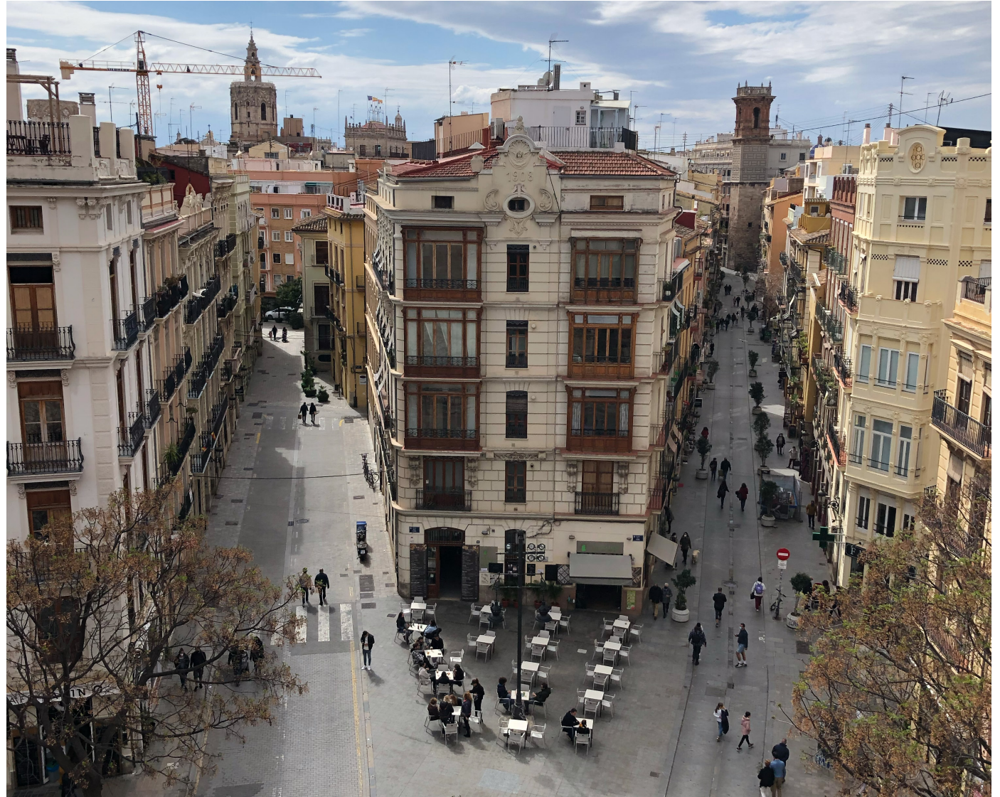
Sicht auf die Altstadt vom Torres de Serranos