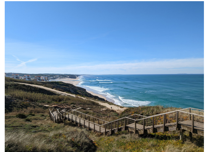
Foz do Arelho