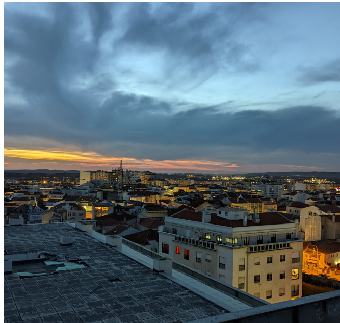
Caldas da Rainha von oben

Portugal ist insgesamt deutlich billiger als Deutschland. Vor allem Obst und Gemüse sind sehr billig und fast immer regional – auf dem täglichen Markt am Praça da Fruta bekommt man es für Centbeträge. Etwas teuer als in Deutschland sind Hygiene- und Haushaltsartikel. Haltbare Lebensmittel sind ungefähr gleich teuer.