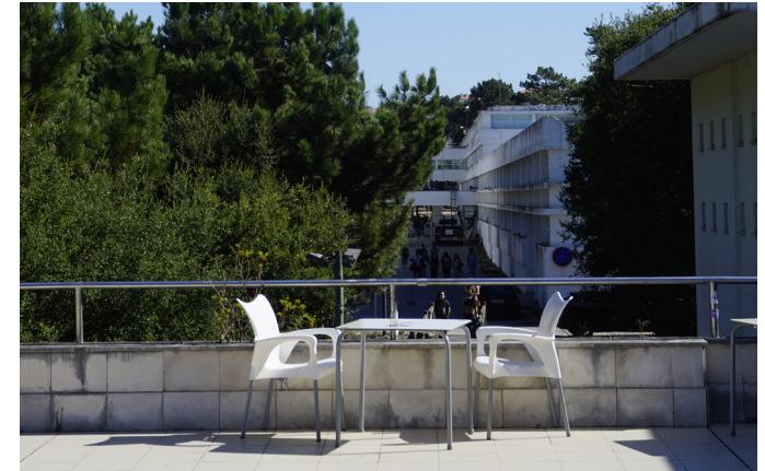
Auf der Terasse der Cafeteria

Bereits am ersten Tag, beim Oriantation Meeting lernt man die meisten internationalen Studenten kennen. Bei uns hat sich dann eine große WhatsApp Gruppe gebildet, in welcher gemeinsame Ausflüge, Partys und Picknicks organisiert wurden. Die anderen Erasmus Studenten sind sehr offen und an neuen Kontakten interessiert und man kann schnell Freunde finden.