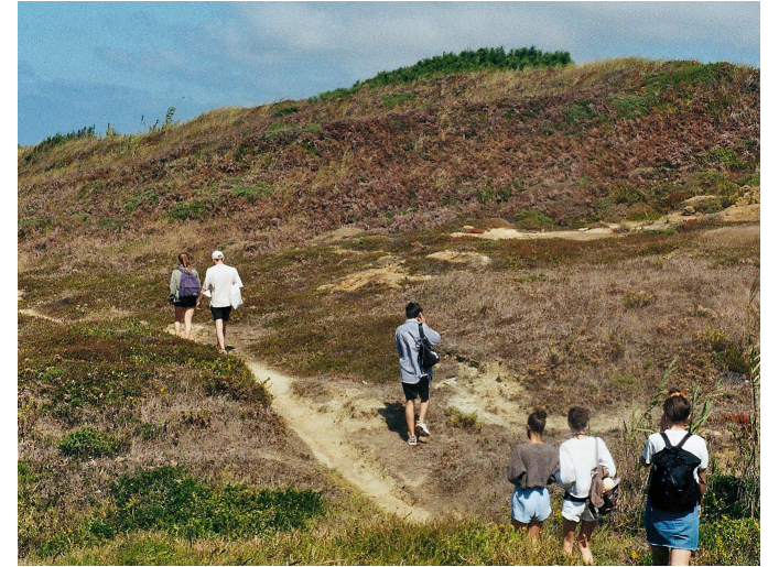
Die Küste entlang