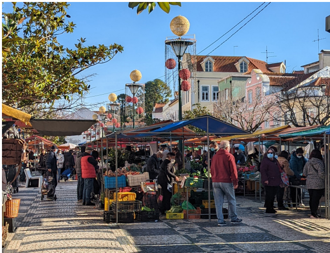
Täglicher Obst und Gemüsemarkt auf dem praça da fruta