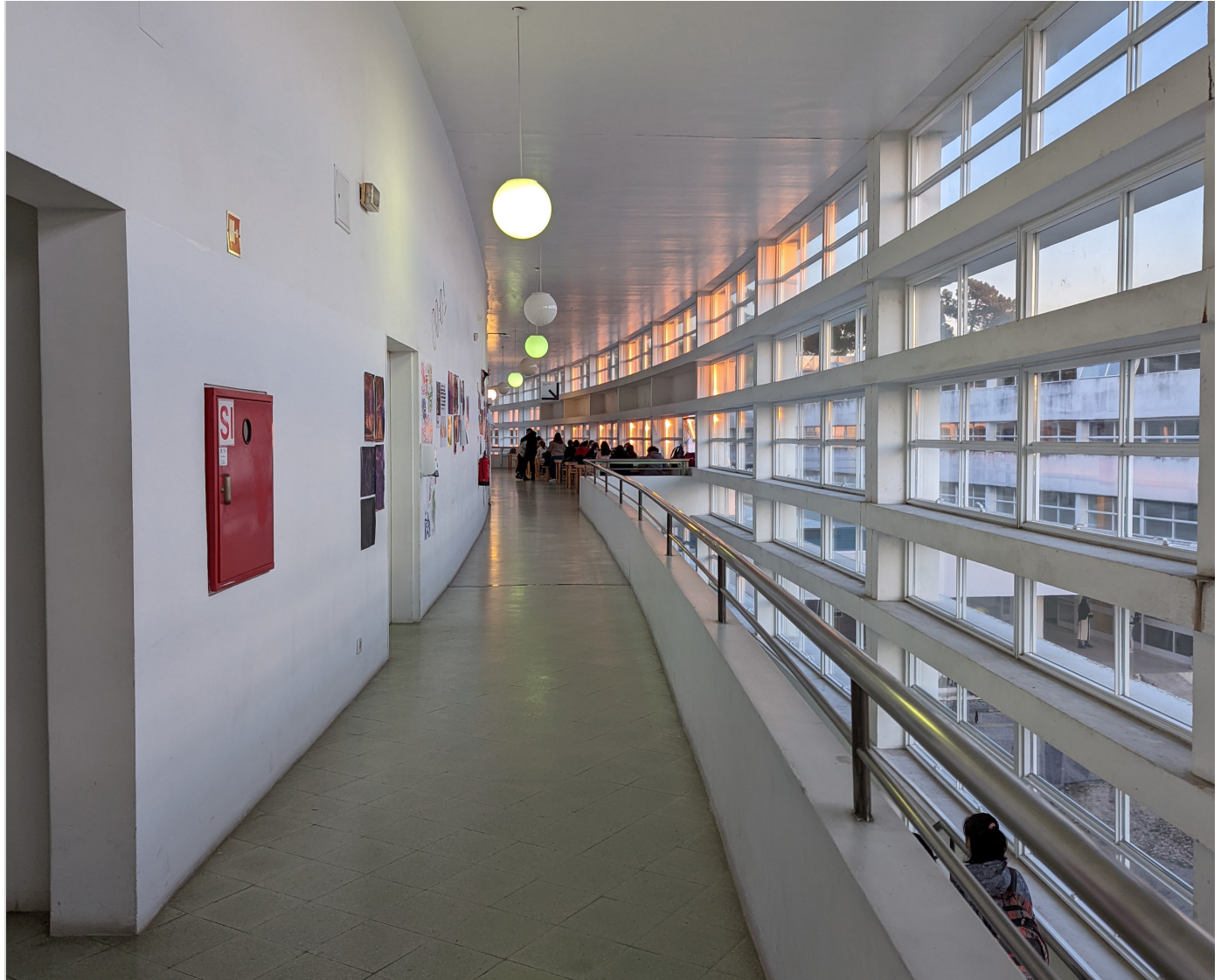
Abends in der ESAD