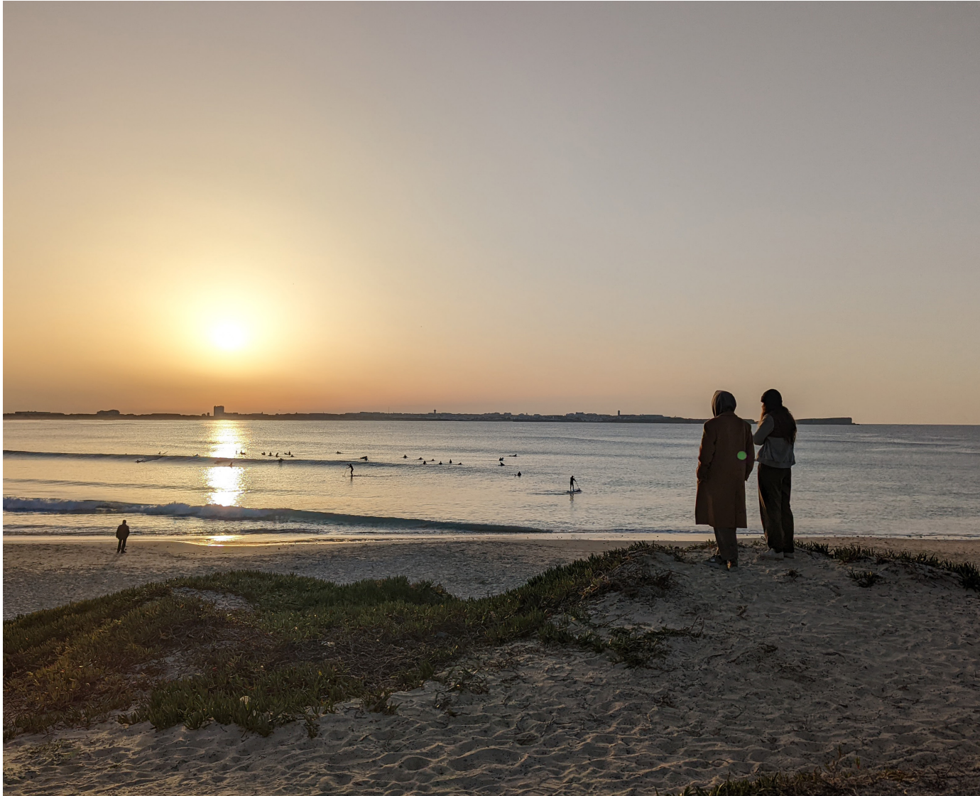
In Baleal nach dem Surfen