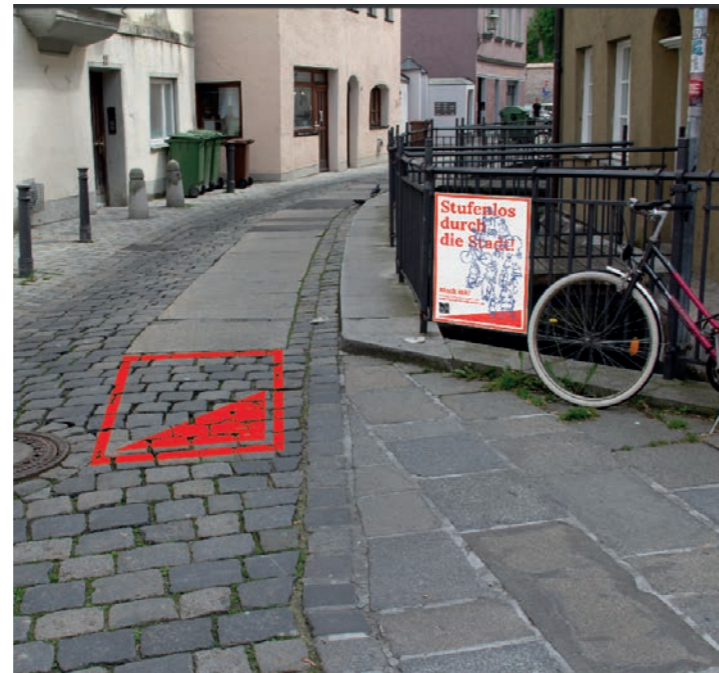
ABB. 6: Entwurf Bodenmarkierung