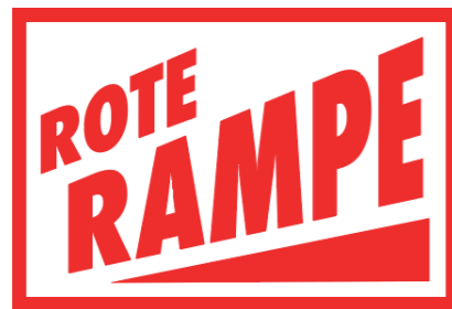
ABB. 3: Entwurf Logo