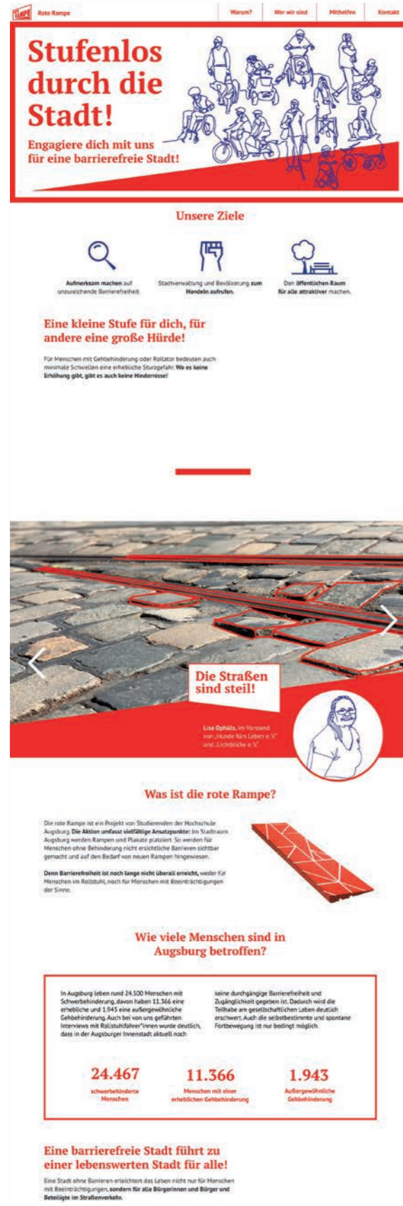
ABB. 8: Entwurf Website („Landingpage“)