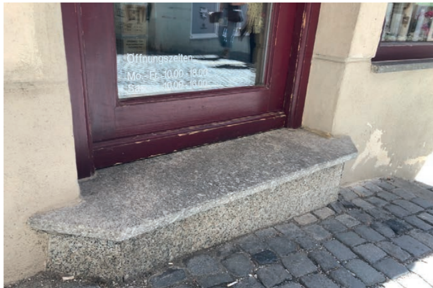
ABB. 1: Beispiel: Stufe an einem Ladeneingang in der Innenstadt Augsburg.