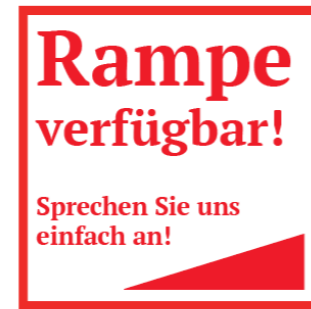
ABB. 9: Entwurf Leitsystem