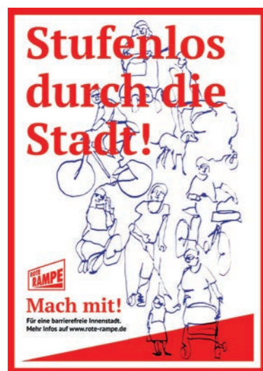
ABB. 4: Layoutentwurf Plakat