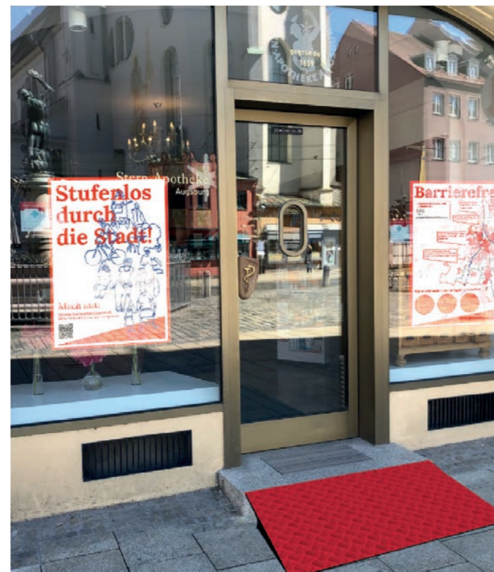
ABB. 7: Anwendungsbeispiel Plakat und Rampe