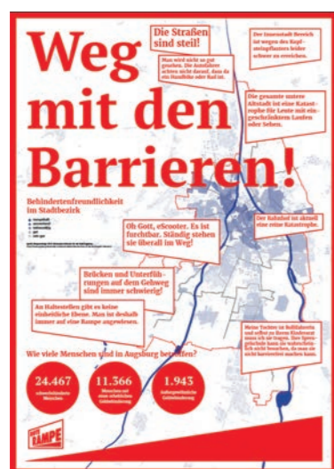
ABB. 5: Layoutentwurf Plakat